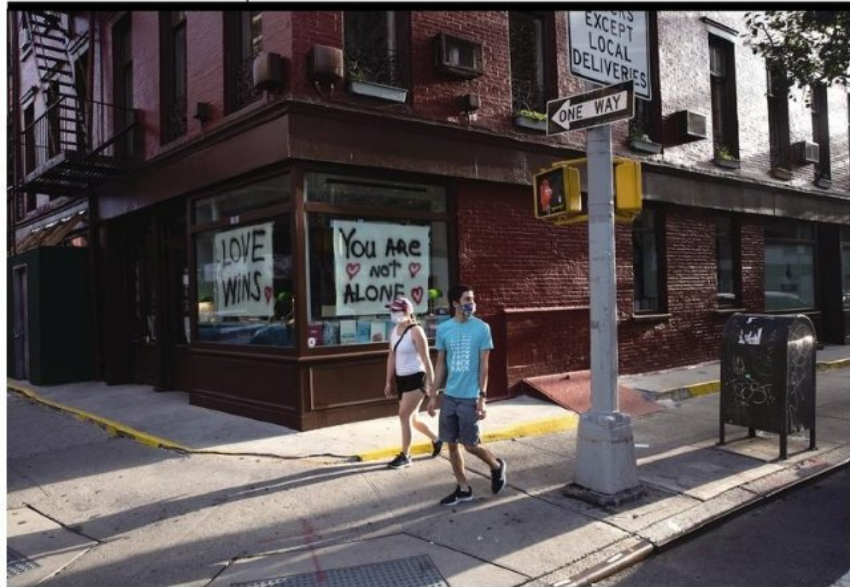
多位美国卫生专家表示,进入秋季也可能意味着,美国将迎来新冠病毒和流感病毒共同流行的“双疫”状态