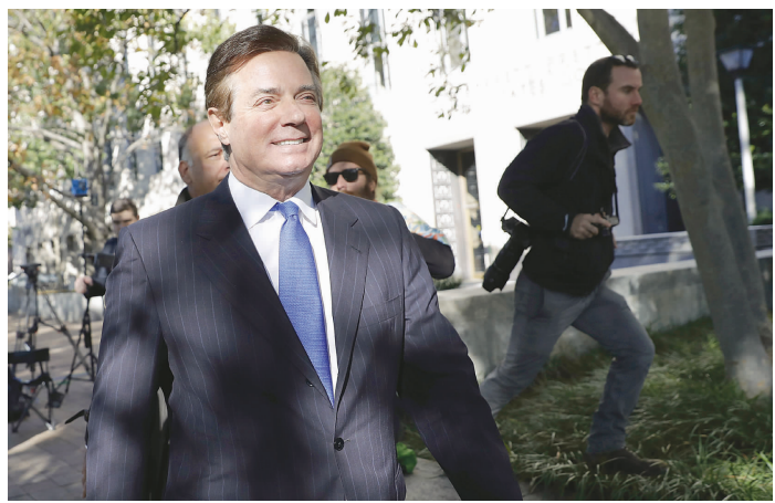
10月30日,特朗普前竞选经理保罗·马纳福特出庭后离开华盛顿联邦法院。

此外检方还指马纳福特和盖茨通过离岸账户隐瞒收入,并提供虚假退税证明,涉案金额高达7500万美元,远超此前媒体报道。如果检方指控的12项罪名坐实,马纳福特将面临12年至15年监