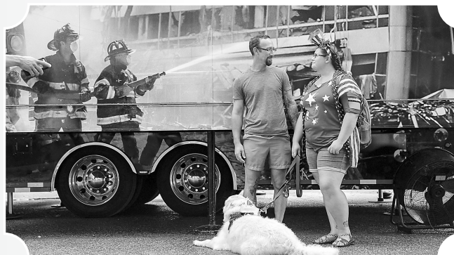
北卡罗来纳州南港一对夫妇站在一个移动的“9·11”博物馆前。

中心和乡村社区等地进行为期数天的流动展览。随着技术进步，展览内容得到极大扩充，博物馆可以将馆藏以3D模拟的数字化形式直接带到观众面前。还有不少移动博物馆增加了动手实践和艺术创作等项目，让人们亲身感受艺术与科学的精彩之处。