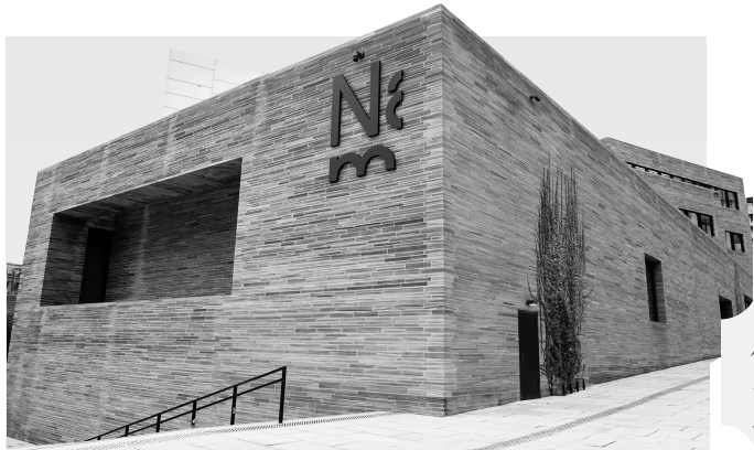
挪威国家博物馆资料图