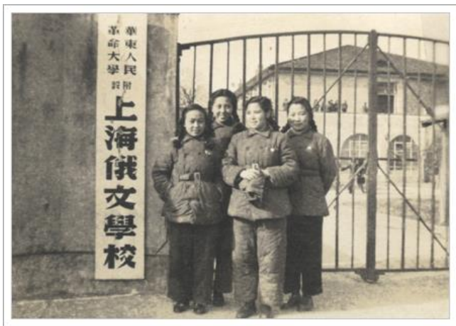
华东人民革命大学附设外文专修学校 (1950 年—1952 年)

当时的上海俄文学校还只是一所专业结构单一、以学习俄语和俄罗斯苏联文学为主的外语类高校，培养的学生主要是俄语口笔译人员和俄语教学师资。