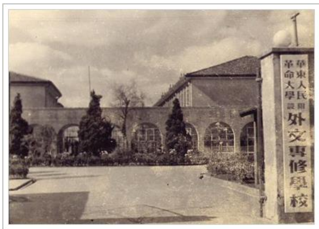
上海俄文专修（科）学校 （1952年—1956年）

陈毅市长对我校十分关心，多次亲临指导，要求我校领导把眼光放远一些，除俄语外，还要培养其他语种专业人才。根据陈毅同志的指示，为配合国家外交外贸工作需要，学校于1950年增设英语班，更名为“华东人民革命大学附设外文专修学校”，校址迁至东体育会路（原暨南大学一院），即现虹口校区校址。1951年4月，学校又建立东方语言文学系，增设缅甸语、越南语和印尼语专业。1952年3月，南京华东军区政治部附设外文专修学校学员150余人并入我校。至1952年8月，学校已初具规模，设俄语、英语、缅甸语、越南语和印度尼西亚语5个语种。